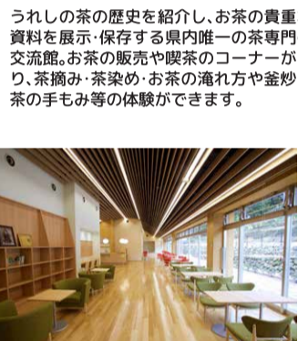
チャオシル喫茶コーナー

うれしの茶の歴史を紹介し、お茶の貴重な資料を展示・保存する県内唯一の茶専門の交流館。お茶の販売や喫茶のコーナーがあり、茶摘み・茶染め・お茶の淹れ方や釜炒り茶の手もみ等の体験ができます。