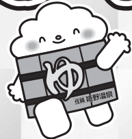
嬉野温泉公式キャラクター ゆつつらくん

嬉野温泉にご宿泊のお客様、地元住民の皆様と一緒にゆく年くる年を、過ごしませんか? 「新年へのカウントダウン」・「初詣」・「初湯」などで、楽しめます。また、嬉野名物「温泉湯どうぶ」等の振る舞いもあります。是非、ご来場ください。