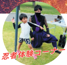
忍者体験コーナー